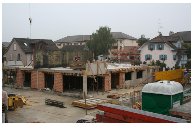
Schalen der Wände im 1.OG Haus B inkl. Versetzen von Balkonbrüstungen in Fertigelementen.