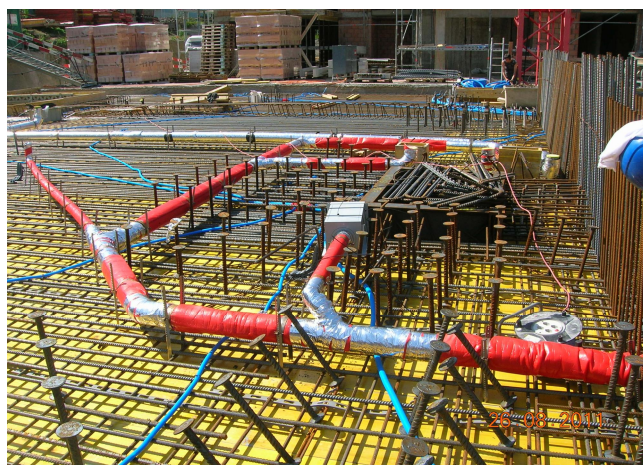
Stütze mit Stahlpilz im Bereich mit konzentrierten Einlagen.