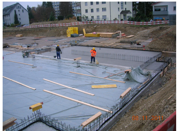
Eingebrachter Beton der Bodenplatte Tiefgarage (Monobeton).